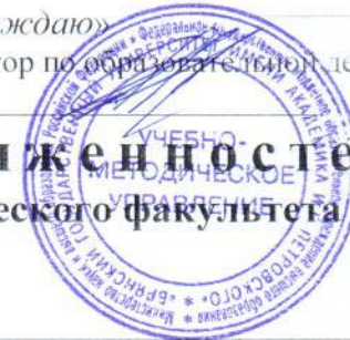
График ликвидации академических задолженностей по итогам летней зачетно-экзаменационной сессии 2 курса физико-математического факультета 2023-2024 учебного года